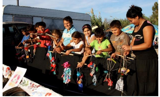
Photo: Animation de création de marionnettes réalisée avec les enfants du bidonville de Marignane. En octobre 2014.

* Association Départementale pour le Développement des Actions de Prévention